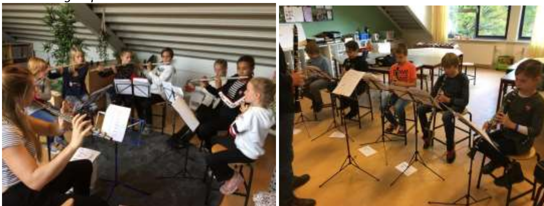
Muziek is ook kunst, de groepen 7 zijn gestart met de blazersklassen.