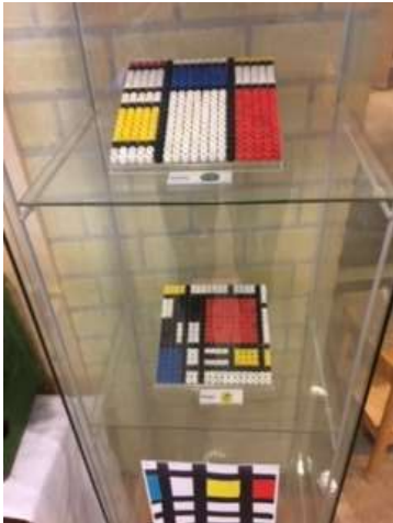
Kralenplankjes in de stijl van Mondriaan.