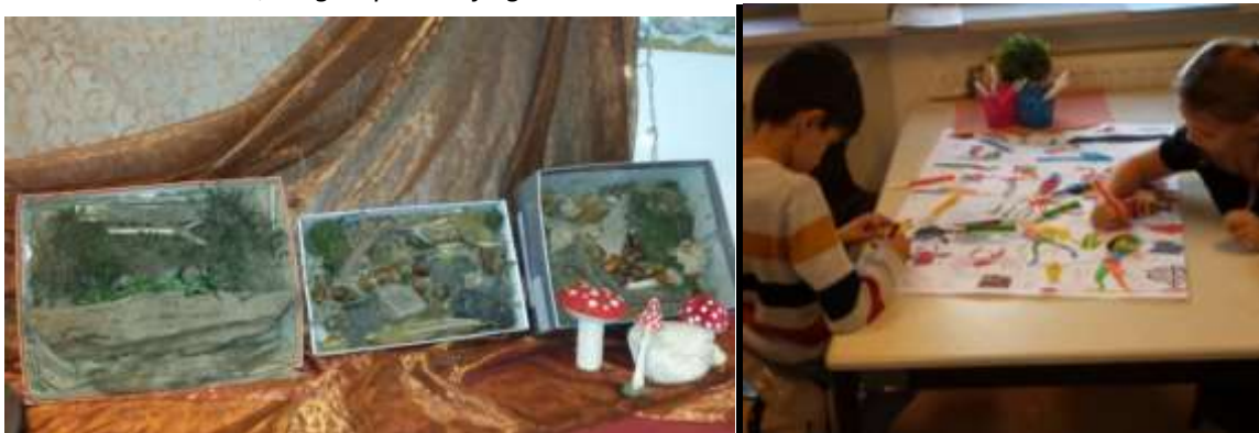
Herfstkunstwerken met materialen uit de natuur in groep 4A. En werken aan een grote kleurplaat, een samenwerking tussen ouders en leerlingen.