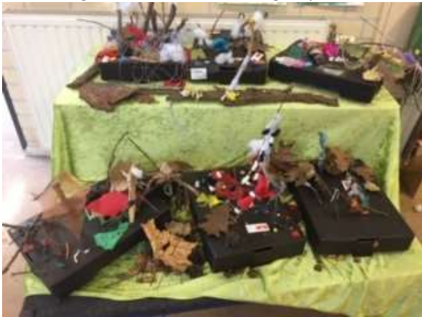
Kunst met verschillende materialen.