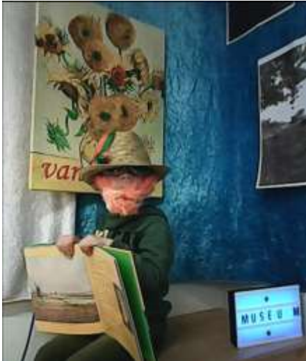
Verkleding in de themahoek van groep 1-2A (welke kunstenaar ben ik?)