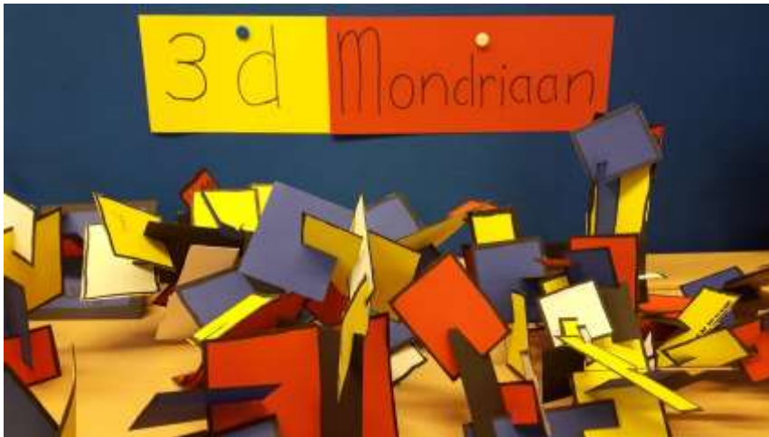
Kunst van groep 8B