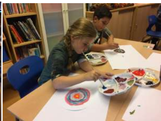
Verf mengen in groep 3 en vervolgens een kunstwerk maken en je laten inspireren door Kandinsky